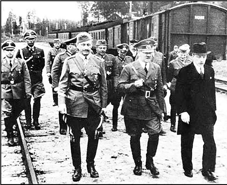
Hitlerin vierailu 4.6.1942 Mannerheimin syntymäpäiville osoitti kahden Neuvostoliittoon hyökänneen maan liittolaissuhteen. Vieraiden joukossa nähtiin Suomen valtionjohtoa kuten kuvassa Hitlerin vierellä kävelevä Risto Ryti. Vierailun yhteydessä nähtiin miten herkästi maamme upseeriston käsi heilahti natsitervehdykseen.